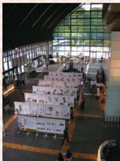
平成20年10月7、8日第2回福岡会場の様子