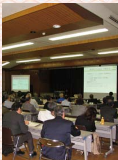
平成20年3月23日の第1回奈良会場の様子

*交流ひろばでは全国各地の保存団体・市民団体・NPO法人等およそ100団体が、活動内容に関するポスター発表を行う予定です。