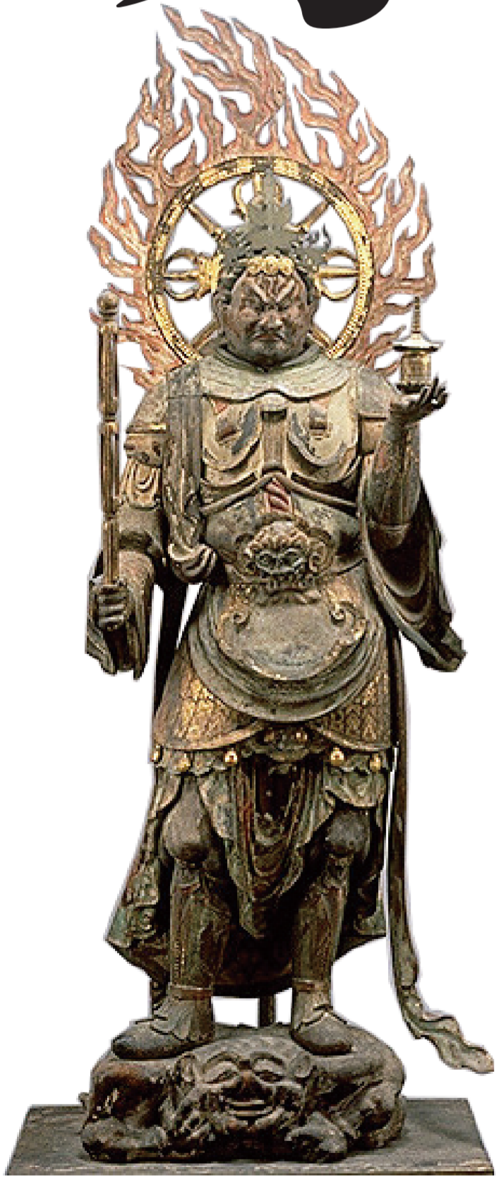
◎国宝 多聞天立像 (京都・浄瑠璃寺蔵)