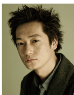
俳優・京都国立博物館文化大使 井浦新