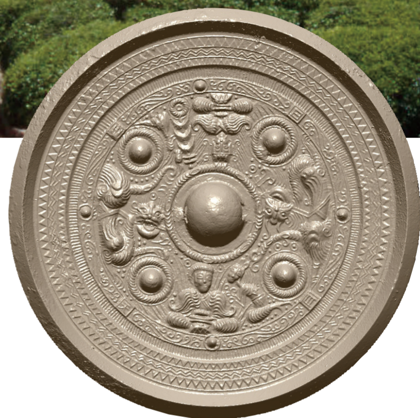
◎重要文化財 愛知県犬山市東之宮古墳出土 三角縁二神二獣鏡 (復元品) (京都国立博物館蔵)