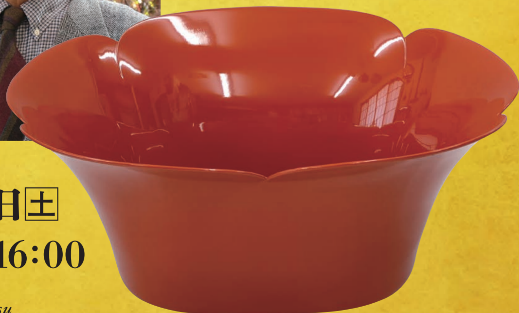
乾漆花鉢 2019年 個人蔵